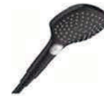
HANSGROHE | Raindance E Duchador