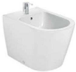
ROCA | Inspira Bidet