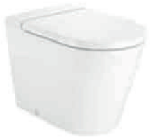
ROCA | Inspira Inodoro