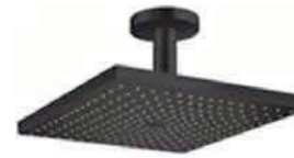
HANSGROHE | Raindance E Ducha