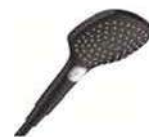
HANS GROHE | Raindance E Duchador