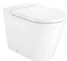
ROCA | Inspira Inodoro