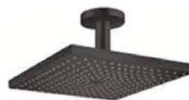
HANS GROHE | Raindance E Ducha