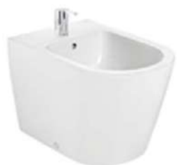
ROCA | Inspira Bidet